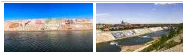
❖ 작 품 명 : 푸에블로 제방 프로젝트 (Pueblo levee Project)